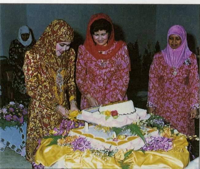
MEMOTONG KEK ... Kebawah Duli Yang Maha Mulia Paduka Seri Baginda Raja Isteri ketika berkenan memotong kek hari puja usia baginda yang dipersembahkan oleh Badan Kebajikan Isteri-Isteri Pegawai dan Pegawai-Pegawai Wanita Kerajaan Brunei (BISTARI) yang dilangsungkan pada 18 Oktober lepas.

Yang Amat Mulia di majlis itu juga telah berkesudian menyempurnakan penyampaian sijil-sijil kepada kedua buah syarikat tersebut termasuk kepada ahli-ahli Jawatankuasa Teknikal Piawai Negara Brunei Darussalam.