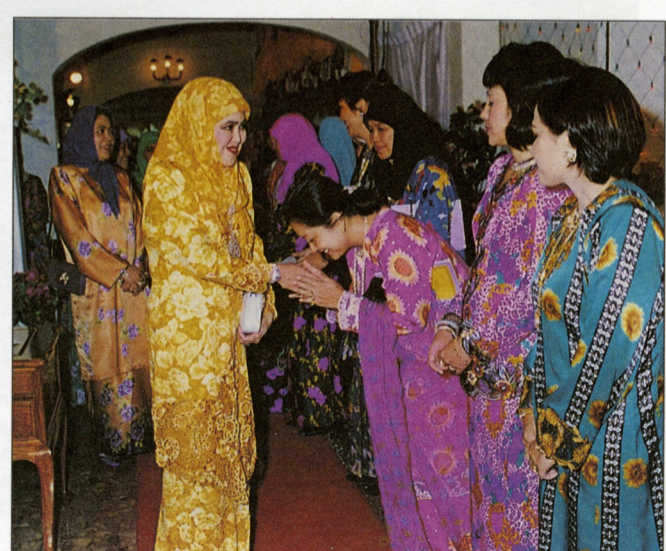
JUNJUNG ZIARAH ... Kebawah Duli Yang Maha Mulia Paduka Seri Baginda Raja Isteri Pengiran Anak Hajjah Saleha ketika berkenan menerima junjung ziarah sebahagian ahli-ahli BAKTI ketika baginda berangkat ke Majlis Santap Petang sempena hari puja usia baginda anjuran BAKTI.